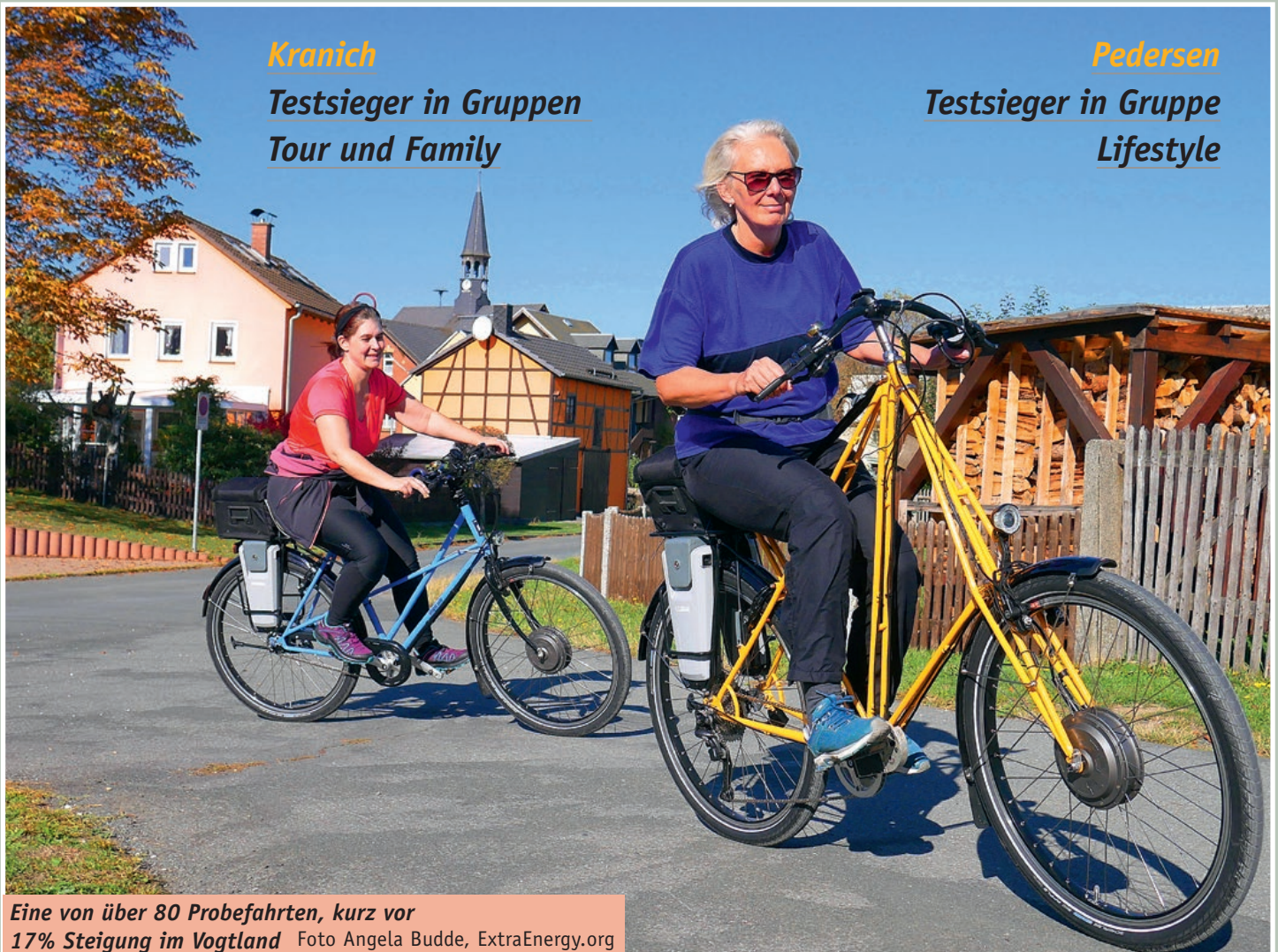
Eine von über 80 Probefahrten, kurz vor 17% Steigung im Vogtland