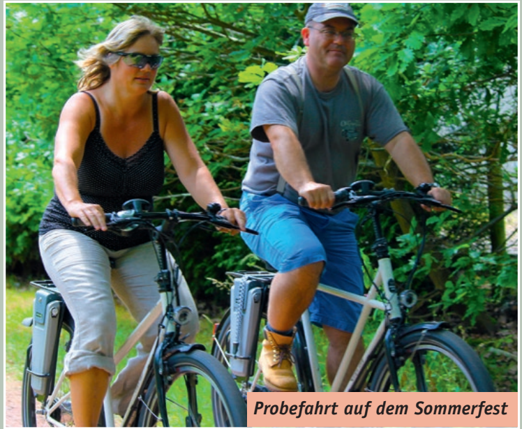
Probefahrt auf dem Sommerfest

http://if-blog.de/rd/der-mercedes-benz-unter-meinen-e-bikes/