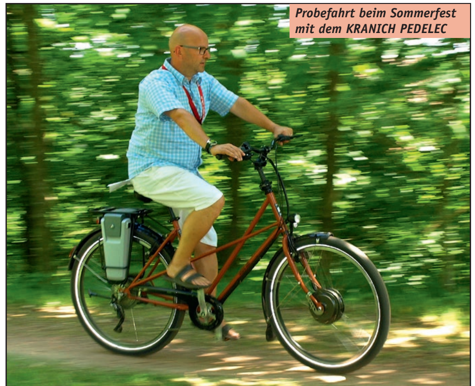
Probefahrt beim Sommerfest mit dem KRANICH PEDELEC

Der Utopia Frontantrieb ist ein DirectDrive, kein Getriebemotor. Er läuft ähnlich leicht